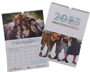
Calendario "mesa" – 5,00 € Calendario "pared" – 10,00 €

Disponibles en nuestra tienda online https://tiendasolidaria.sonrisamedica.org/ y bajo pedido en info@sonrisamedica.org . Posibilidad de entrega a domicilio y empaquetado.