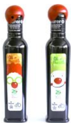
Oli d'oilva virgen extra – 10,00 €