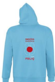
Sudaderas – 25,00 euros