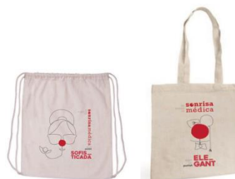
Mochilas (8€) y totebags (6€)