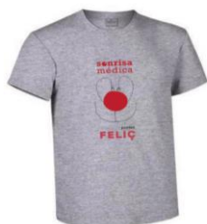
Camisetas – 10,00 euros