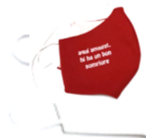
Mascarillas – 7,00 €