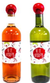
Vi de Nassos – 10,00 €