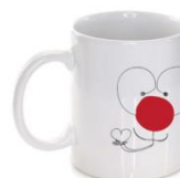
Taza solidaria – 8,00 euros