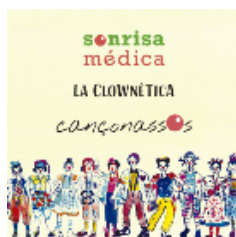
CD Cançonassos – 12,00 €